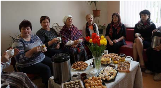
Pie svētku galda Murmastienē.