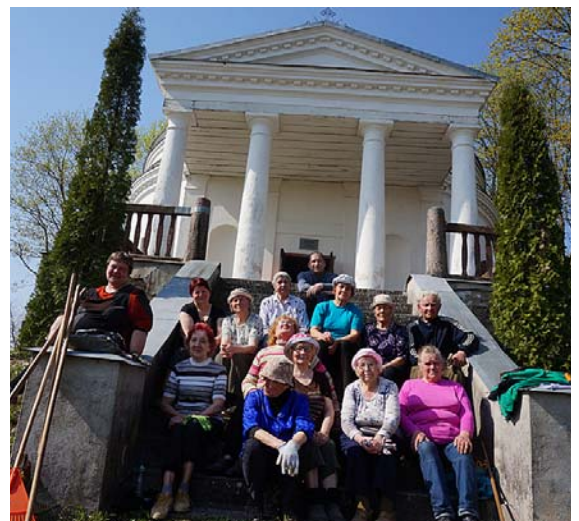
Talkotāji pie sv. Viktora kapelas.